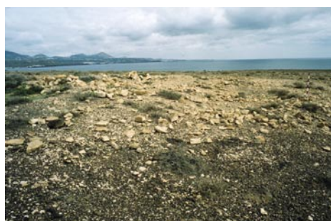
Yacimiento Paleontológico de Papagayo. Yaiza

Emisión de informes en la tramitación de instrumentos urbanísticos de protección, tales como Planes Especiales de Protección de Zonas Arqueológicas, Sitios Históricos y Conjuntos Históricos, así como en todos aquellos que puedan afectar a bienes de interés cultural o incluidos en cartas arqueológicas, terrestres y submarinas, paleontológicas o etnográficas.