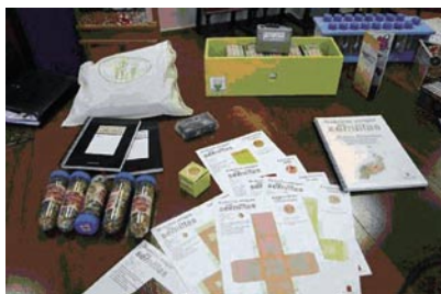
Maleta didáctica “Nuestras amigas las semillas”

En los diferentes centros escolares se ha puesto en marcha la actividad “Nuestras amigas las semillas, una propuesta didáctica en torno a los cultivos tradicionales”. Además próximamente dispondremos de la maleta didáctica sobre “La Cultura del Agua”.