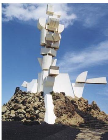
Monumento al Campesino. San Bartolomé

Incoación e instrucción de los expedientes de bien de interés cultural.