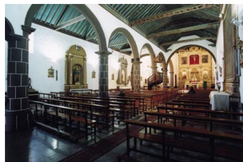
Iglesia de San Roque. Tinajo

Desarrollo del Plan Sectorial de Patrimonio Histórico, con una vigencia de 10 años.