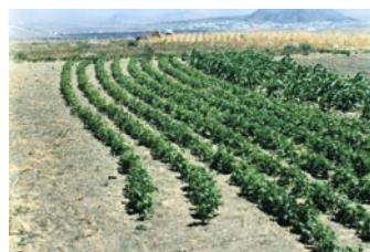
Cultivos en Jable

A través de diferentes convenios con el ICFEM se ha trabajado durante varias anualidades en la recopilación, tanto de la memoria agrícola como de la cultura del agua en Lanzarote. Por ello, se ultima la edición del libro Los Cultivos Tradicionales de la Isla de Lanzarote, Los Granos: Diversidad y Ecología , así como una publicación sobre el agua en Lanzarote.