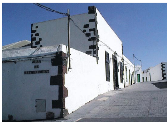
Conjunto Histórico de Tegüise

Autorizaciones de obras, usos e intervenciones en Conjuntos Históricos carentes de Plan Especial de Protección aprobado, así como en el resto de los bienes de interés cultural y entornos de protección.