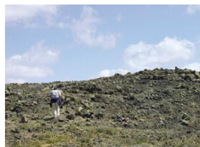
Zona Arqueológica de Maciot

Vigilancia, inspección y potestad sancionadora. Seguimiento de un plan de vigilancia.