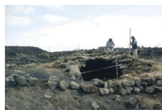
Excavación Arqueológica en Testeyna, Tías

En materia arqueológica, se realizan diferentes excavaciones y prospecciones arqueológicas terrestres y subacuáticas. Además, se imparten charlas y visitas guiadas a los diferentes colectivos.