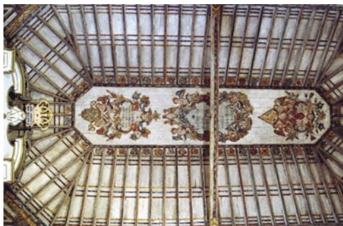
Restauración del techo de la Iglesia de Nuestra Señora de los Remedios, Yaiza

En las diferentes partidas presupuestarias y siguiendo el Plan Sectorial, se reserva un apartado destinado a la restauración y rehabilitación de bienes de interés cultural.