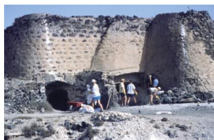
Campo de Trabajo. Restauración de pozos y caleras en Arrieta

A través de diferentes convenios con el ICFEM se ha trabajado durante varias anualidades en la recopilación, tanto de la memoria agrícola como de la cultura del agua en Lanzarote. Por ello, se ultima la edición del libro Los Cultivos Tradicionales de la Isla de Lanzarote, Los Granos: Diversidad y Ecología , así como una publicación sobre el agua en Lanzarote.