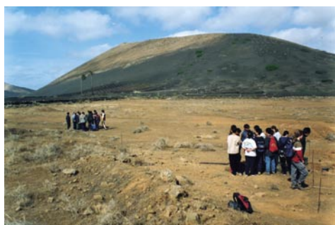
Visita guiada al Yacimiento de La Geria